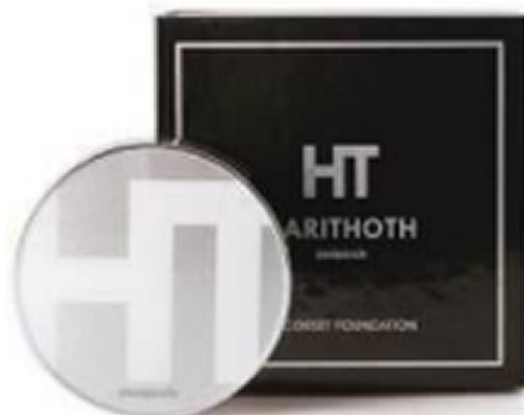
【460】HARITHOTH HT コルセットファンデーション