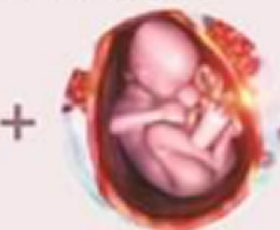
ヒト臍帯血幹細胞順化培養液を配合