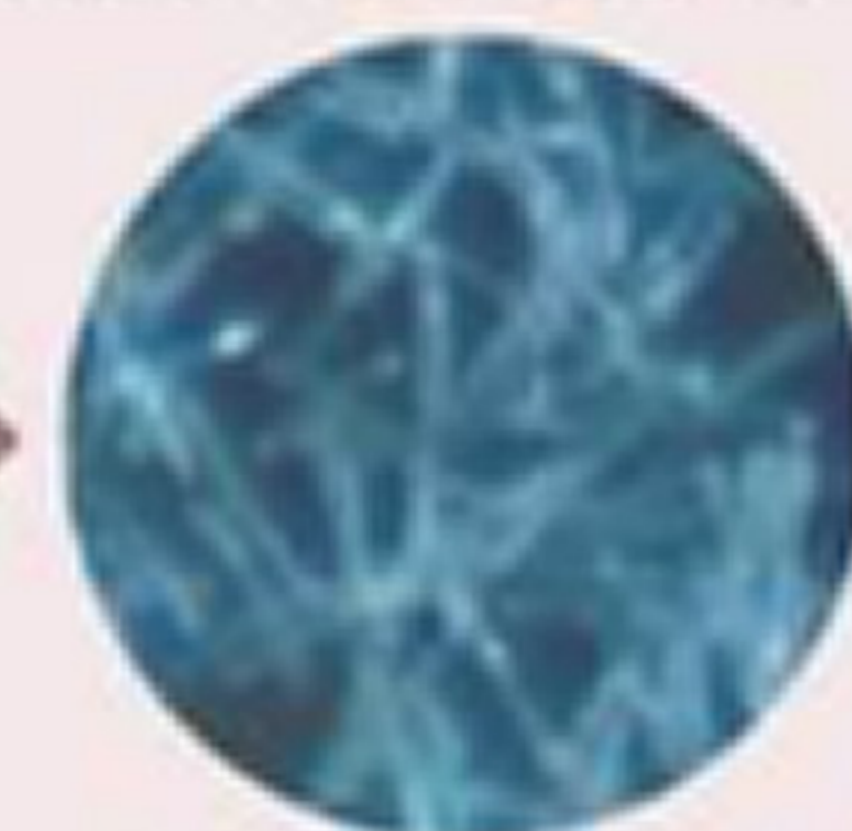
イノスピキュール